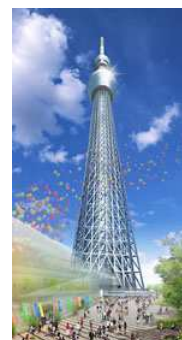
(東京スカイツリー完成予想図)

※ 東京スカイツリーは高さ610mで、2012年春開業予定だそうです。楽しみですね。