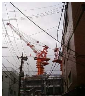
(建設中の東京スカイツリー)