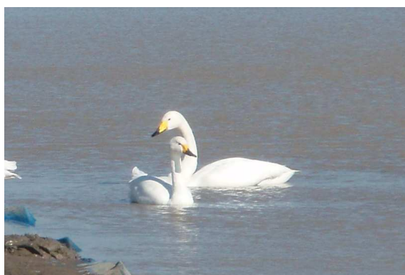
千葉県本埜村「白鳥の郷」にて

に就任するバラク・オバマ上院議員です。1兆ドルの財政赤字によるドル暴落を防ぎながら、彼の行動力と先見性で公約通り変革を実行し、米国発経済復興で新しい時代を切り拓いてほしいと願っています。