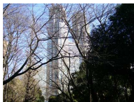
熊野神社から都庁を望む